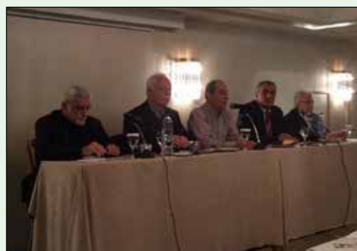
Από την κοπή πίτας στην Αθήνα

Ευχαριστούμε τους διοργανωτές και όλους τους συναδέλφους που παρευρέθηκαν.