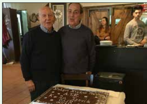
Φωτογραφίες από τις εκδηλώσεις στην Καρδίτσα και τα Τρίκαλα