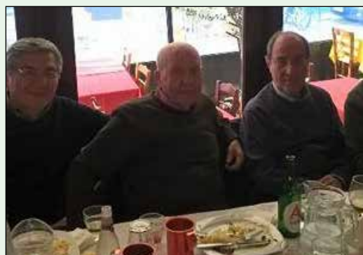
Από την κοπή πίτας στη Λάρισα